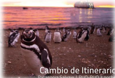
Cambio de Itinerario Patagonia Salvaje | PUQ-PUQ 3 noche

Día 3: Bahía Almirantazgo – Glaciar Parry // Día 4: Isla Magdalena – Punta Arenas